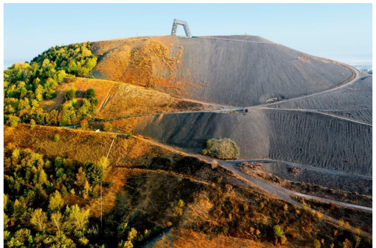
Bergehalden mit Saarpolygon, Ensdorf, 2020

Die großformatigen Fotografien von Werner Richner vermitteln ein Stück der Magie, die von den Landschaften, den Menschen und der Architektur ausgeht.